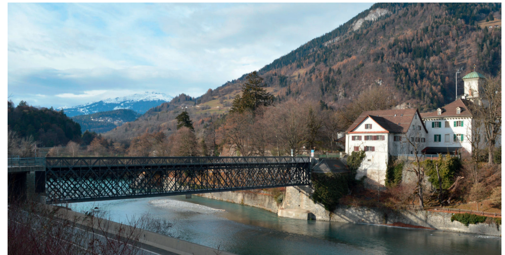
Rheinbrücke Reichenau GR

Stahlbrücken machen einen Bruchteil der Kunstbauten der Verkehrsinfrastruktur aus, doch gehören sie ebenso zur Baukultur wie die Spannbetonbrücken des Nationalstrassennetzes oder die steinernen Brücken der Albulabahn. Sie entstanden oft um die 19./20. Jahrhundertwende und sind nun Gegenstand tiefgreifender Instandsetzungen, um ihre Funktion auf erhöhte Bedürfnisse anzupassen. Wie dies gelingt, zeigen fünf realisierte Umbauten und eine Semesterarbeit. Neben der üblichen Korrosionsschutz-erneuerung sind es vielfältige Bauaufgaben, die anspruchsvolle und manchmal einzigartige technische Umsetzungen hervorrufen. Im Sinne eines Erfahrungsaustauschs erläutern die Projektverfasser die von ihnen entwickelten Lösungen.