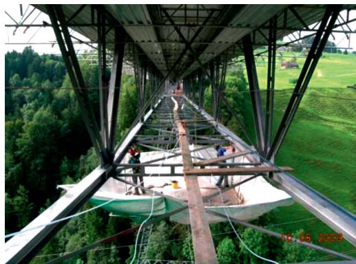
Haggenbrücke bei St. Gallen