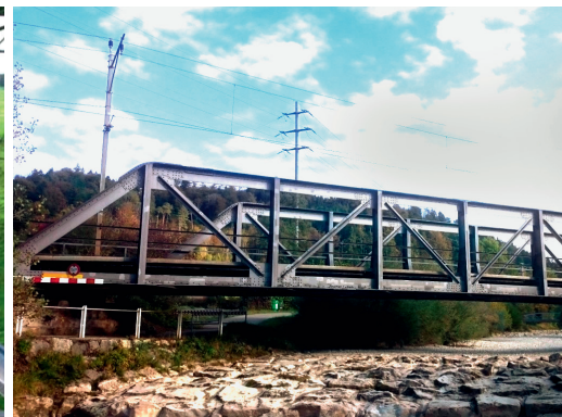
Eisenbahnbrücke Turbenthal-Wila ZH