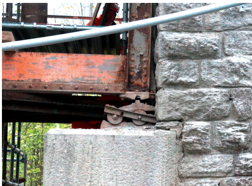
Vorderrheinbrücke Valendas GR