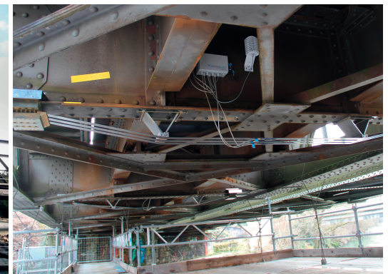
Birsbrücke bei Münchenstein BL