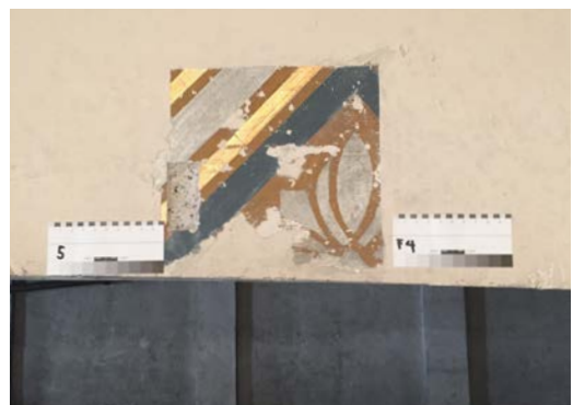
Freilegung historischer Farbgebung