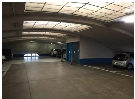
Nutzung als Garage