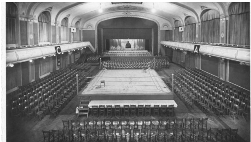
Stadthalle als Boxarena